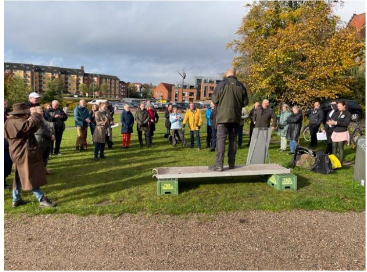
Miljøminister Magnus Heunicke holder tale.