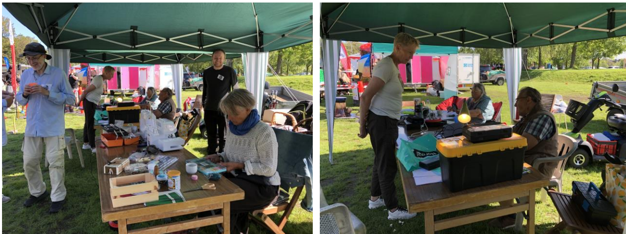
Repaircaféen på Foreningernes dag i Rådmandshaven.

Vejret var i top, og der var mange, der kiggede forbi vores stand.