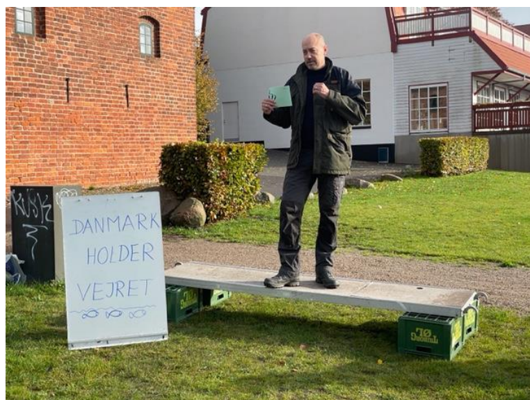
Miljøminister Magnus Heunicke