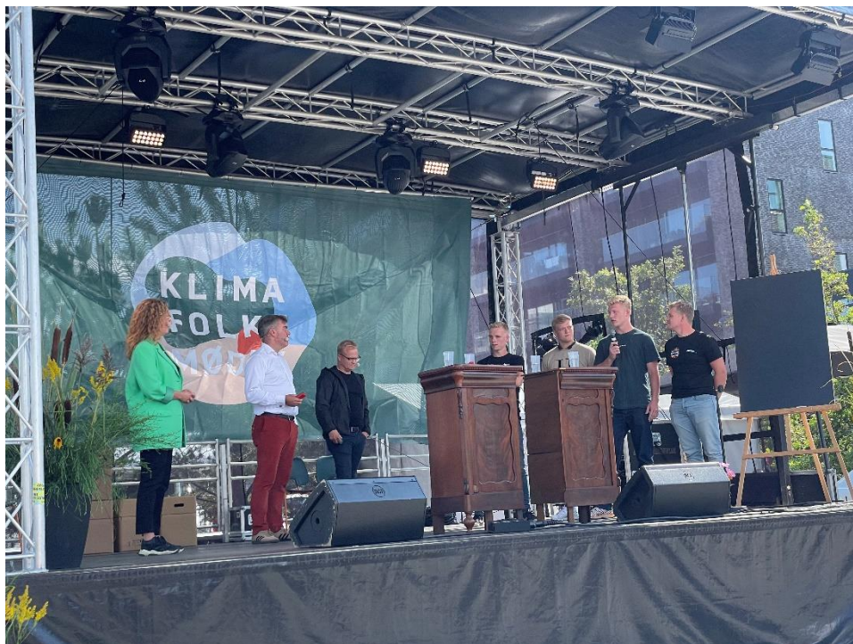
Klima-, energi- og forsyningsminister Lars Aagaard svarer på spørgsmål fra et kritisk ungt panel.

(Det skal dog siges, at de personer, der deltog, udtrykte stor tilfredshed med arrangementet).