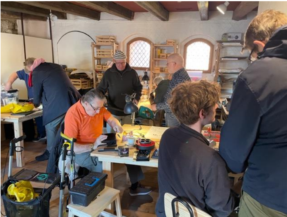
Stemmingsbillede fra en travl dag i værkstedet.

MEN HUSK: ingen Repaircafé i juli måned.